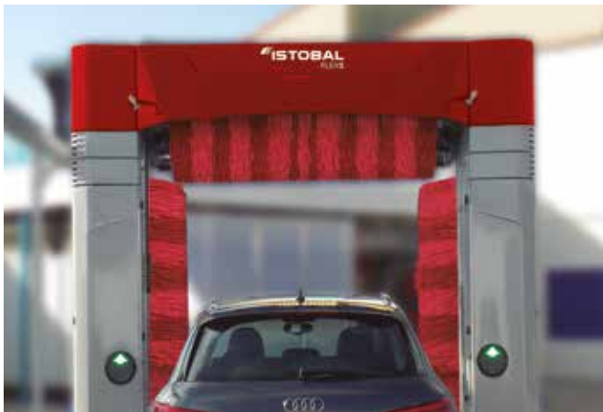
ISTOBAL FLEX5 con 3 cepillos